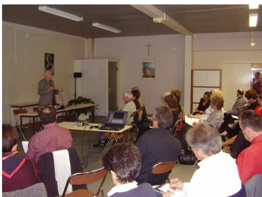
Le président ouvre la séance